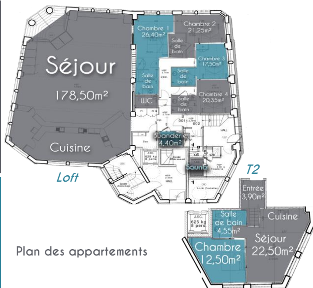
Plan des appartements